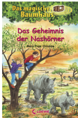
Das magische Baumhaus (Band 61) - Das Geheimnis der Nashörner