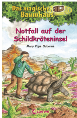
Das magische Baumhaus (Band 62) - Notfall auf der Schildkröteninsel