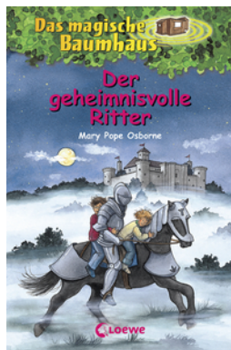
Das magische Baumhaus (Band 2) - Der geheimnisvolle Ritter