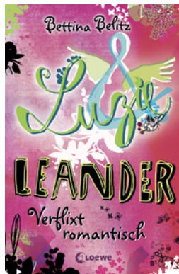
Luzie & Leander - Verflixt romantisch