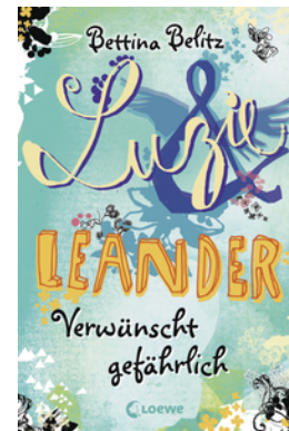
Luzie & Leander - Verwünscht gefährlich