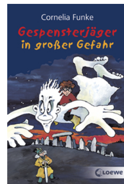
Gespensterjäger in großer Gefahr