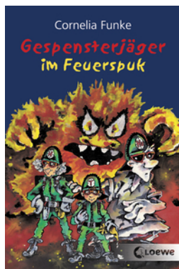
Gespensterjäger im Feuerspuk