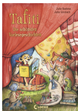
Tafiti - Die schönsten Vorlesegeschichten