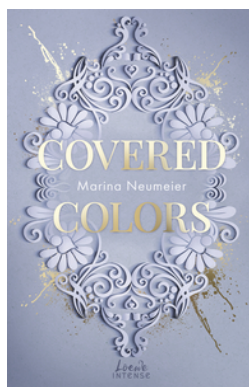
Covered Colors (Golden Hearts, Band 2)