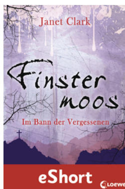
Finstermoos – Im Bann der Vergessenen