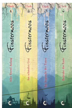
Finstermoos - Die komplette Reihe inkl. eShort