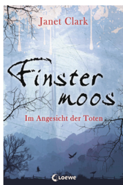
Finstermoos – Im Angesicht der Toten