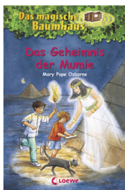
Das magische Baumhaus (Band 3) - Das Geheimnis der Mumie