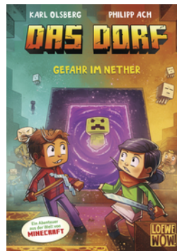
Das Dorf (Band 2) - Gefahr im Nether