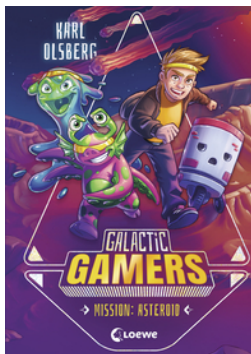
Galactic Gamers (Band 2) - Mission: Asteroid