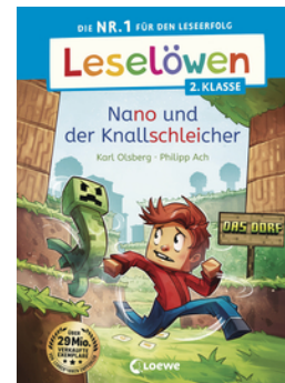
Leselöwen 2. Klasse - Nano und der Knallschleicher