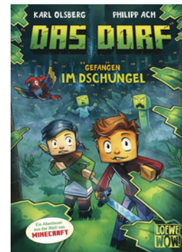
Das Dorf (Band 3) - Gefangen im Dschungel