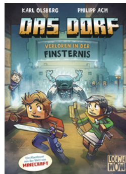
Das Dorf (Band 6) - Verloren in der Finsternis