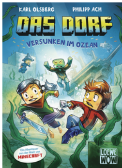
Das Dorf (Band 5) - Versunken im Ozean