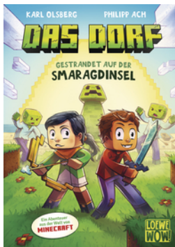
Das Dorf (Band 1) - Gestrandet auf der Smaragdinsel