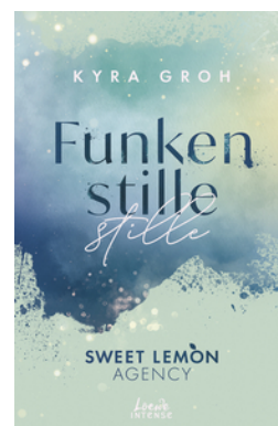
Funkenstille (Sweet Lemon Agency, Band 3)