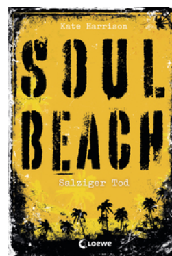
Soul Beach (Band 3) – Salziger Tod