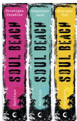
Soul Beach - Die komplette Trilogie