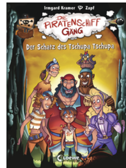
Die Piratenschiffgänger 4 - Der Schatz des Tschupa Tschupa