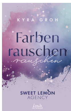
Farbenrauschen (Sweet Lemon Agency, Band 2)