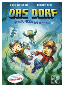
Das Dorf (Band 5) - Versunken im Ozean