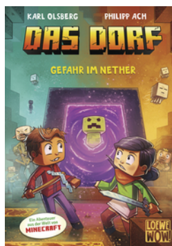
Das Dorf (Band 2) - Gefahr im Nether