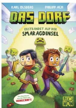
Das Dorf (Band 1) - Gestrandet auf der Smaragdinsel