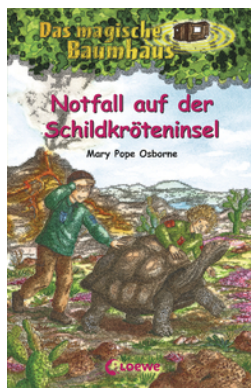
Das magische Baumhaus (Band 62) - Notfall auf der Schildkröteninsel