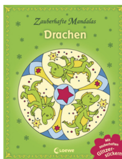
Zauberhafte Mandalas: Drachen (mit Glitzerstickern)