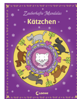
Zauberhafte Mandalas - Kätzchen