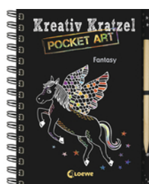
Kreativ-Kratzel Pocket Art: Fantasy