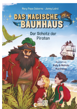
Das magische Baumhaus (Comic-Buchreihe, Band 4) - Der Schatz der Piraten