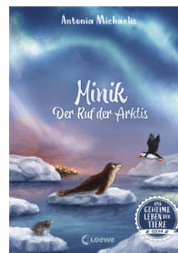
Das geheime Leben der Tiere (Ozean) - Minik - Der Ruf der Arktis