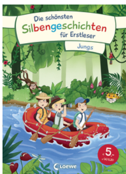
Die schönsten Silbengeschichten für Erstleser - Jungs