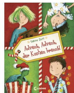
Advent, Advent, der Kuchen brennt!