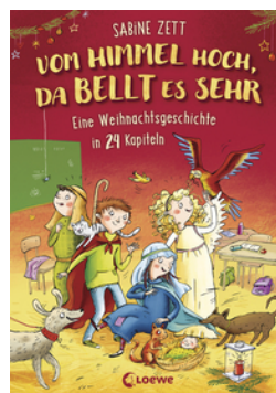
Vom Himmel hoch, da bellt es sehr - Eine Weihnachtsgeschichte in 24 Kapiteln