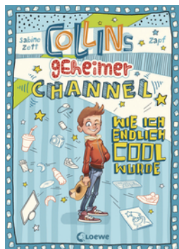
Collins geheimer Channel (Band 1) - Wie ich endlich cool wurde