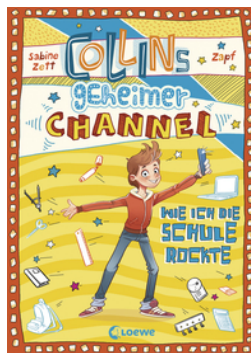
Collins geheimer Channel (Band 2) - Wie ich die Schule rockte