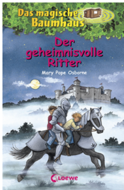
Das magische Baumhaus (Band 2) - Der geheimnisvolle Ritter