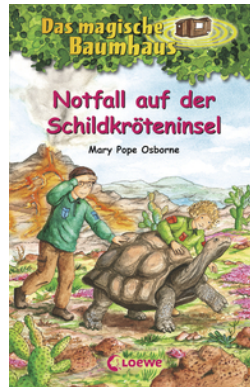
Das magische Baumhaus (Band 62) - Notfall auf der Schildkröteninsel