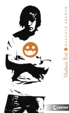
Vladimir Tod kämpft verbissen