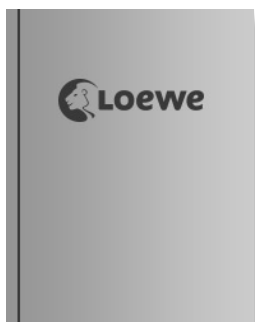
Vladimir Tod beisst sich durch