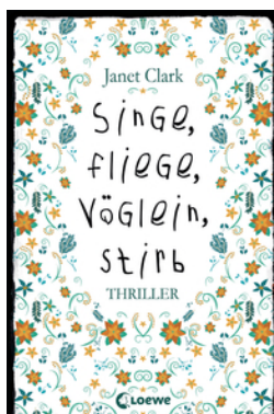
Singe, fliege, Vöglein, stirb