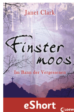
Finstermoos – Im Bann der Vergessenen