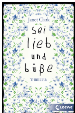
Sei lieb und büße