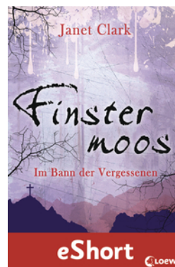
Finstermoos – Im Bann der Vergessenen