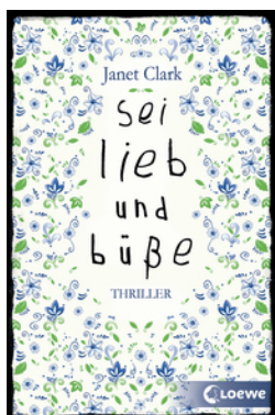
Sei lieb und büße