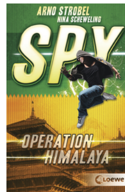
SPY (Band 3) - Operation Himalaya