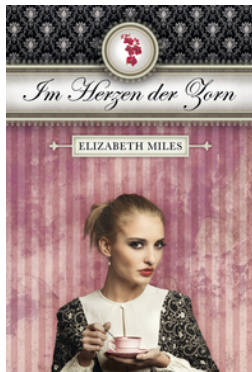
Furien-Trilogie – Im Herzen der Zorn