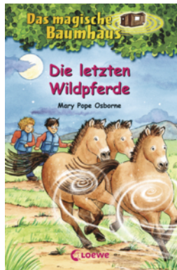
Das magische Baumhaus (Band 63) - Die letzten Wildpferde