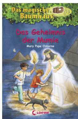
Das magische Baumhaus (Band 3) - Das Geheimnis der Mumie