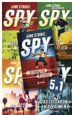
SPY - Die komplette Reihe