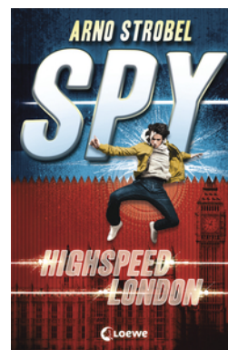
SPY (Band 1) - Highspeed London