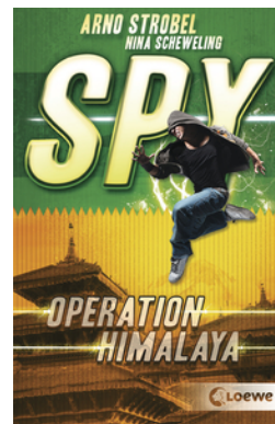
SPY (Band 3) - Operation Himalaya