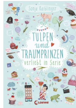
Verliebt in Serie (Band 3) - Tulpen und Traumprinzen