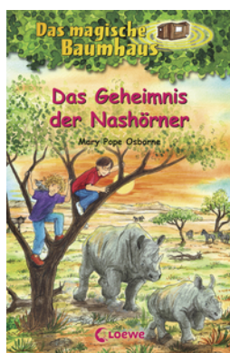
Das magische Baumhaus (Band 61) - Das Geheimnis der Nashörner