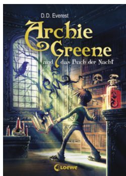
Archie Greene und das Buch der Nacht