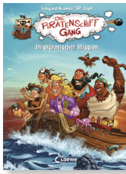
Die Piratenschiffgänger - In stürmischer Mission