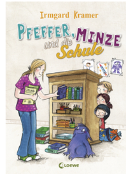
Pfeffer, Minze und die Schule