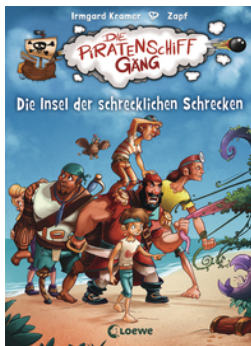
Die Piratenschiffgänger – Die Insel der schrecklichen Schrecken