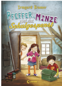
Pfeffer, Minze und das Schulgespenst